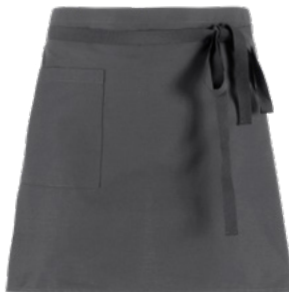
M12 Grigio medio