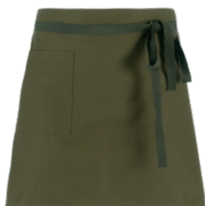
Z43 Military green