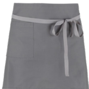
C02 Grigio chiaro